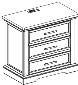
Cabinet Body *1